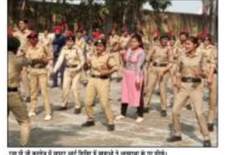
एक पक्ष में कालेज में स्टाफर अर्द्ध शिविर में छात्राओं ने अस्त्ररक्षा के गुरु की...